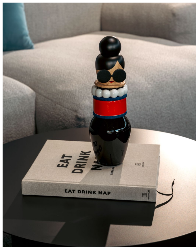
SOPHIA mit ihren einzelnen Komponenten.