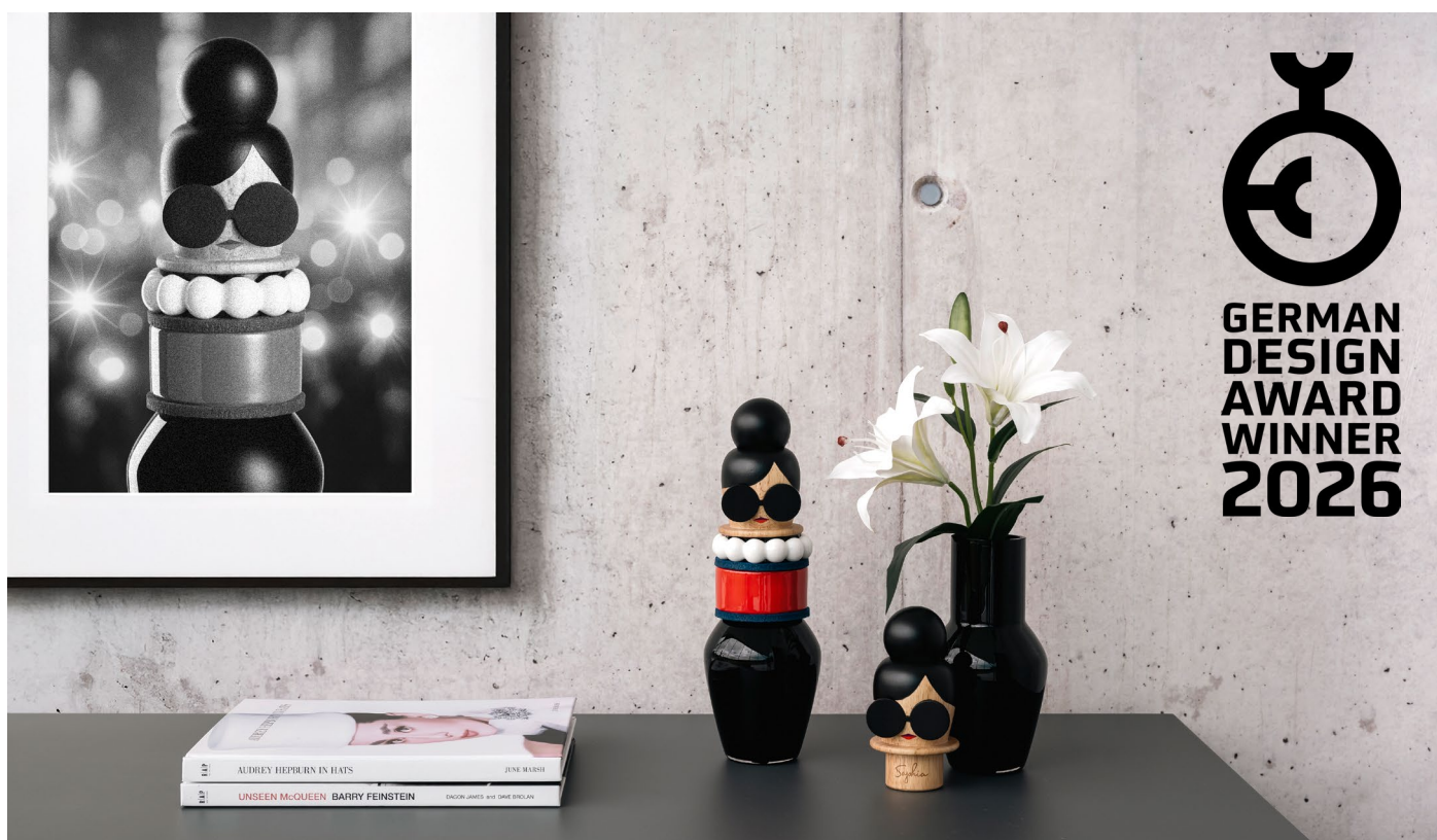
BUONI AMICI - SOPHIA

Mit dem German Design Award 2026 für SOPHIA unterstreicht LEONARDO einmal mehr den eigenen Anspruch, Produkte zu entwickeln, die über reine Funktion hinausgehen und durch Gestaltung, hochwertige Materialien und Verarbeitung überzeugen.