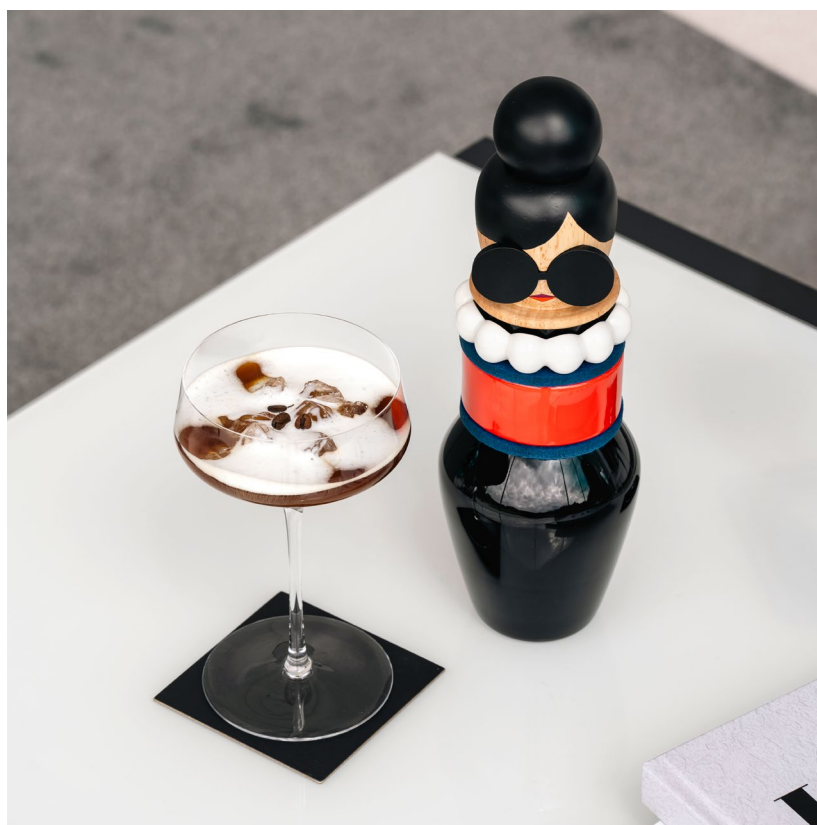
BUONI AMICI - SOPHIA